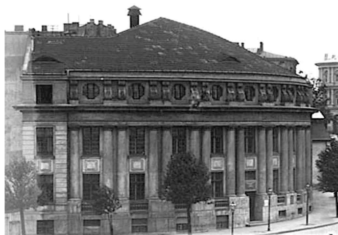
Fot. 4. Budynek PTH na fotografii z 1932 r.