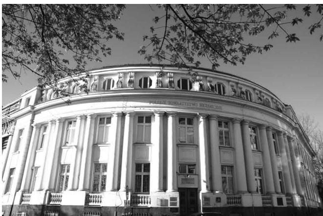
Fot. 1. Współczesny widok gmachu Polskiego Towarzystwa Higienicznego

Wpisany na Listę światowego dziedzictwa kulturowego i przyrodniczego ludzkości jako historyczne centrum Warszawy na mocy prawa międzynarodowego w dniu 2 września 1980 r. przez Komitet UNESCO; jednym z podstawowych kryteriów wpisu był unikatowy, niezwykle udany fakt odbudowy zespołu historycznego.