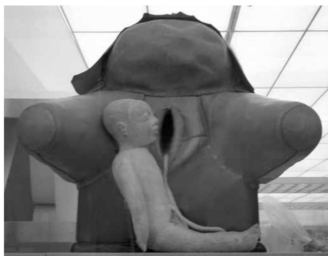
Ryc. 7. Jeden z eksponatów przedstawiających poród z kolejnymi jego etapami

Fig. 7. One of exhibits presenting stages of childbirth