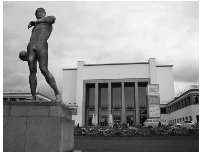
Ryc. 3. Rzeźba lekkoatlety przed wejściem głównym do Deutsches Hygiene-Museum