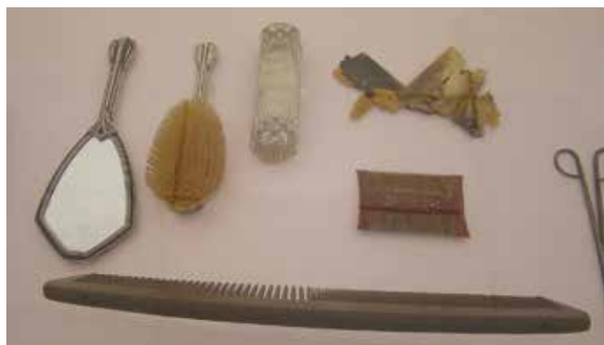
Ryc. 11. Przykład z ekspozycji historycznych przyborów kosmetycznych