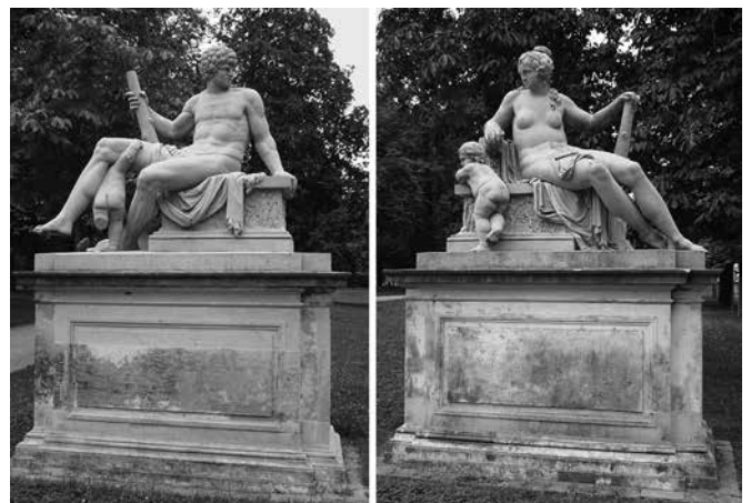
Ryc. 4. Stylizowane na antyczne rzeźby w parku przy Deutsches Hygiene-Museum