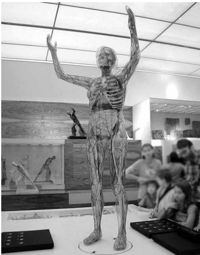
Ryc. 6. Szklany Człowiek ( Gläserner Mensch )