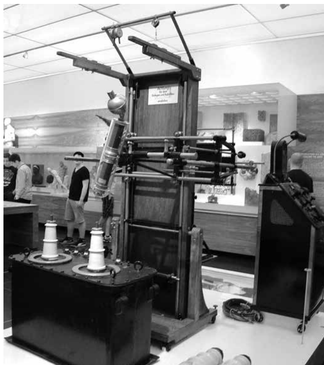
Ryc. 5. Przykład jednego z pierwszych aparatów rentgenowskich Fig. 5. Example of one of first X-ray devices

aparaty rentgenowskie (ryc. 5). Nowoczesnego sprzętu medycznego nie ma; są za to o nim wzmianki zamieszczone na interesująco opracowanych planszach z bogatymi ilustracjami.