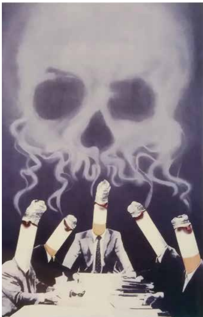
Ryc. 10. Historyczny przykład plakatu o tematyce przeciwytoniowej