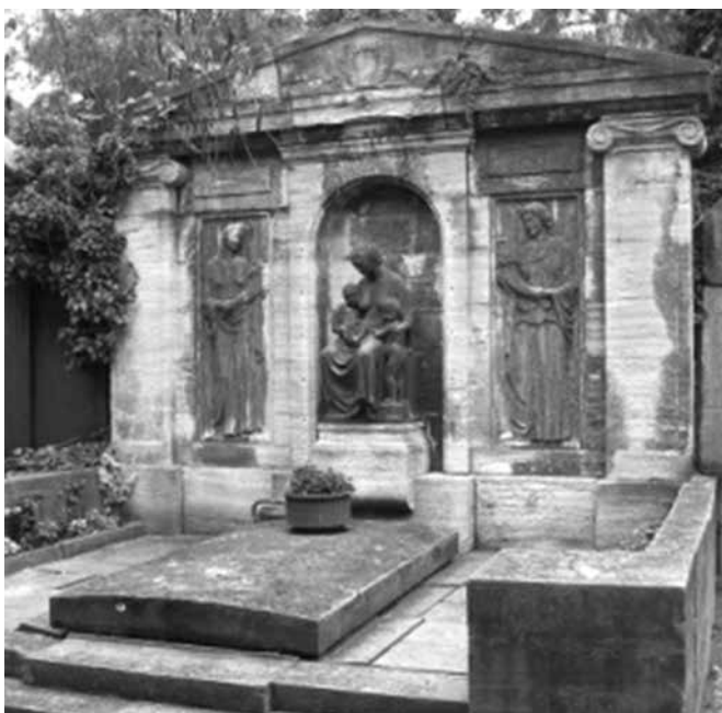
Ryc. 2. Grobowiec rodziny Lingner-Johannisfriedhof in Dresden [4]